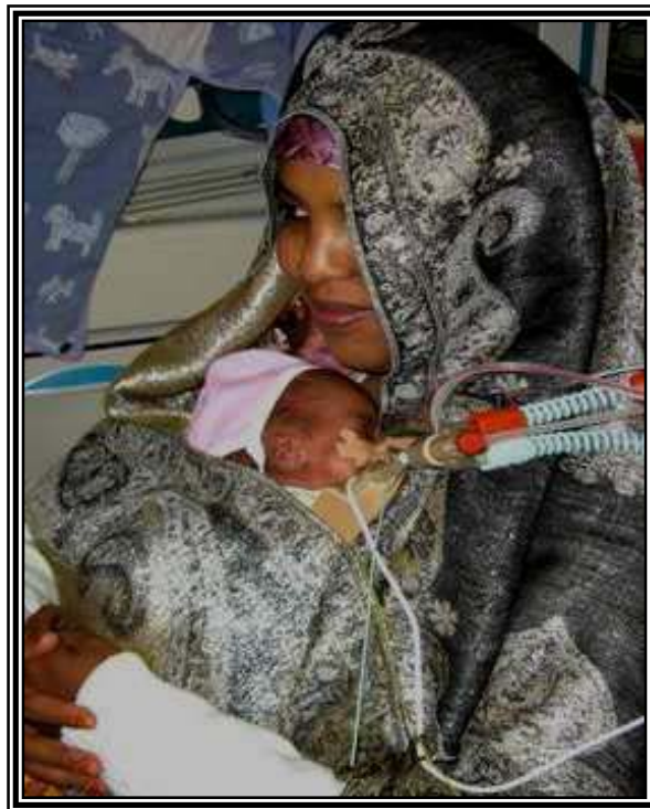
Kuva 4. Vauvan voinnin vakiinnuttua kenguruhoito voi alkaa

Sinun olisi hyvä valmistautua pitkään paikallaoloon huolehtimalla perusasioista, esimerkiksi syömisestä ja juomisesta, ennen kenguruhoidon aloittamista. Jos imetät, muistathan huolehtia riittävästä nesteytyksestä kenguruhoidon aikana. Sopiva määrä on lasillinen nestettä tunnissa. Voit ottaa mukaan myös kirjan tai lehden, jota voit lukea vauvan nukkuessa.