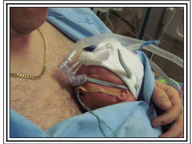
Kuva 2. Isän kanssa kengurussa

Kenguruhoitoa voivat saada kaikki keskoset iästä tai syntymäpainosta riippumatta. Tärkein kriteeri on, että vauvasi vointi on vakiintunut niin, että hänet voi siirtää kenguruhoitoon. Hengityskonehoito ei ole este kenguruhoidon toteuttamiselle.