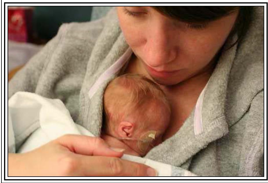
Kuva 5. Vauva on helppo asetella joustavan paidan sisälle

Sinulla voi olla päälläsi esimerkiksi trikoinen toppi tai muuten joustava tai napitettava paita. Tärkeintä on, että vauva on helppo asetella paidan sisälle.