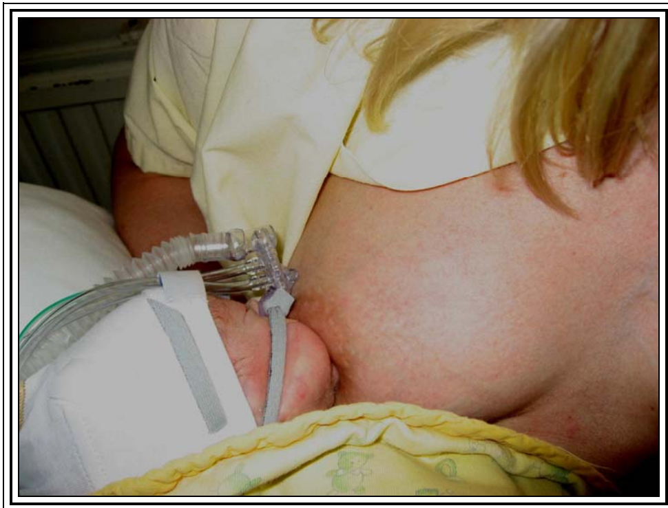
Kuva 9. Rintaruokintaa toteutetaan kenguruhoitossa vauvan vireystilan mukaan

Pyydä apua aina, jos vähänkin epäröit! Hoitajat ovat lähettävillä ja vastaavat mielellään kysymyksiisi!