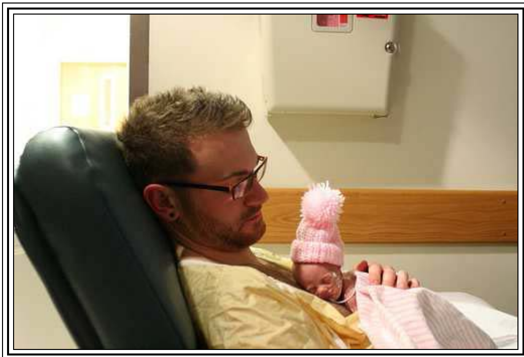
Kuva 7. Hyvän asennon löytäminen on tärkeää, jotta myös sinä pystyt rentoutumaan

Vauva saattaa aluksi kiemurrella, mutta tätä on turha pelästyä. Hän vain etsii mukavaa asentoa. Myös sinun olisi tärkeää löytää asento, jossa sinun on hyvä olla. Hoitaja ohjaa sinua mukavan asennon löytämisessä ja asennon parantamisessa kenguruhoidon aikana. Koska osastoilla on käytössä erilaisia kenguruhoitotuoleja, kannattaa kokeilla jo etukäteen, missä asento tuntuu parhaimmalta. Tavoitteena on, että pystyisit istumaan rentona mahdollisimman pitkään.