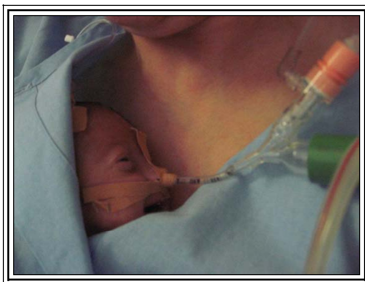
Kuva 1. Kenguruhoidon riemua

Suomessa hoitomuoto otettiin käyttöön 1980-luvun loppupuolella, ja siitä lähtien sitä on toteutettu vastasyntyneiden teho- ja valvontaosastoilla.